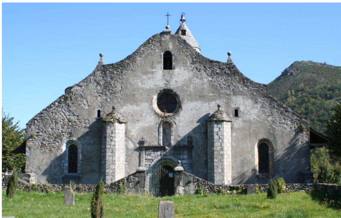
Luzenac de Moulis